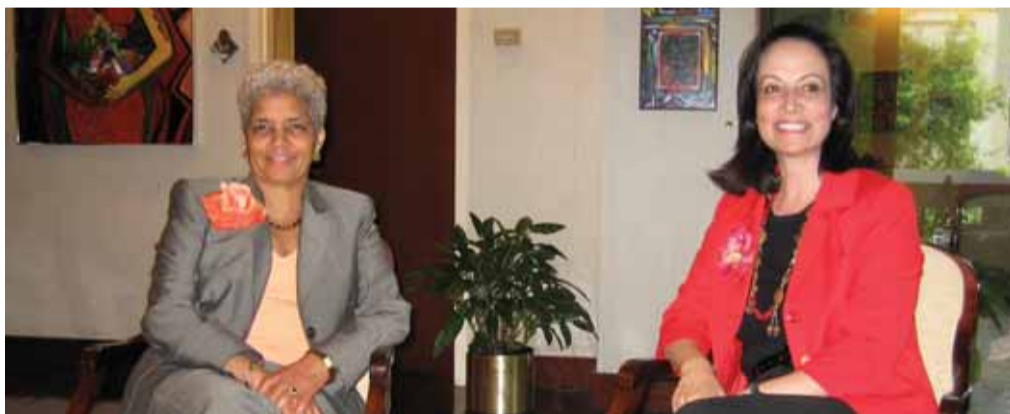
Η Άννα Διαμαντοπούλου με τη δήμαρχο της Ατλάντα Shirley Franklin

Συνήθως, όταν οι πολιτικοί επισκέπτονται το εξωτερικό, η δημοσιότητα και οι συναντήσεις ορίζονται με επικοινωνιακό γνώμονα και όχι στη βάση μιας ουσιαστικής ανταλλαγής απόψεων και εμπειριών.