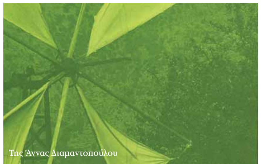
Της Άννας Διαμαντοπούλου

Η επαφή μου με αυτή την πραγματικότητα την περίοδο που υπηρέτησα ως Επίτροπος της Ευρωπαϊκής Ένωσης - και μάλιστα αρμόδια για θέματα κοινωνικής πολιτικής - ήταν η βάση στην οποία στηρίχθηκε η θέση που διατύπωσα το 2006 στο βιβλίο μου «Έξυπνη Ελλάδα» για την ανάγκη μιας νέας παγκόσμιας διακυβέρνησης. Με ένα νέο ρόλο του Διεθνούς Οργανισμού Εργασίας (ILO), του Διεθνούς Οργανισμού Εμπορίου (WTO) και της Παγκόσμιας Τράπεζας , καθώς και την ανάγκη για ένα νέο διεθνή Οργανισμό Περιβάλλοντος, στα πλαίσια του ΟΗΕ.